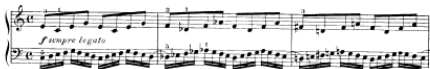
شكل يوضح تمرين رقم (٤)

تمرين رقم ٤ تبادل الأدوار بين تمرين رقم ٤ وتمرين رقم ٢ حيث زيادة السرعة الايقاعية لليد اليسرى باستخدام ايقاع وتؤدي اليد اليمنى ايقاع في نفس سلام التمرين السابق والأداء المسيطر هو أداء اليد اليسرى .