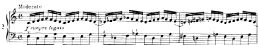
شكل يوضح تمرين رقم (٢)

تمرين رقم ٢ قام المؤلف بمضاعفة السرعة الايقاعية حيث تؤدي اليد اليمنى نفس السلام السابق ذكرها ولكن في ايقاع بينما اليد اليسرى ايقاع في شكل سلمى صاعد وهابط .