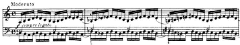
شكل يوضح تمرين رقم (٧)

تمرين رقم ٧ زيادة السرعة الايقاعية باليدين معافى أداء نغمات سلمية يتخللها بعض المسافات البسيطة بايقاع \text{♩} في اتجاه معاكس لليدين مع تثبيت لنغمات البلانش باليد اليسرى لكل مازورة .