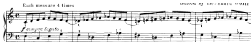
شكل يوضح تمرين رقم (١)

تمرين رقم ٢ قام المؤلف بمضاعفة السرعة الايقاعية حيث تؤدي اليد اليمنى نفس السلام السابق ذكرها ولكن في ايقاع بينما اليد اليسرى ايقاع في شكل سلمى صاعد وهابط .