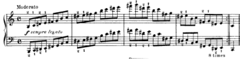
شكل يوضح تمرين رقم (٢٣)

تمرين رقم ٢٣ عبارة عن نغمات سلمية يتخللها بعض المسافات البسيطة وتبدأ فى الشكل الصاعد ثم الهابط فى ميزان C وسرعه معتدلة ويشير المؤلف الى التدريب ثمانى مرات وتؤدى اليدين فى اتجاه واحد نفس النغمات بنفس علامات التحويل .