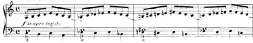
شكل يوضح تمرين رقم (٥)

تمرين رقم ٦ أداء نفس السلام الصغيره لتمرين رقم ٥ ولكن بمضاعفة السرعة لليدين ويرتكز الأداء لليد اليمنى بينما تؤدي اليد اليسرى نغمات الأساس وأصوات ممتدة بأستخدام علامة البلانش لكل اثنين نوار .