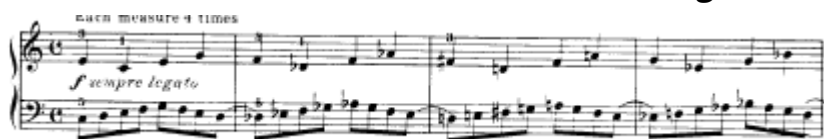
شكل يوضح تمرين رقم (٣)

تمرين رقم ٣ في التمرين يعكس المؤلف لتؤدي اليد اليسرى ايقاع واليد اليمنى نوار في نفس السلام السابق استخدامها في تمرين رقم ٢،١ ولكن تؤديها اليد اليسرى وتصاحبها اليد اليمنى بنغمات الأساس .