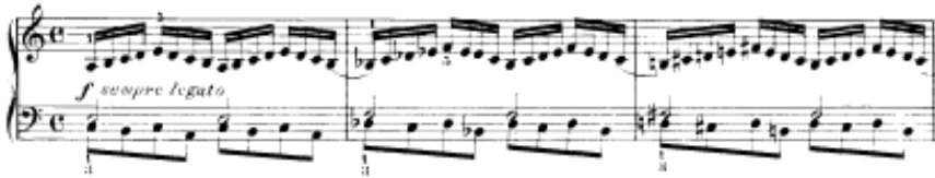
شكل يوضح تمرين رقم (٦)

تمرين رقم ٦ أداء نفس السلام الصغيره لتمرين رقم ٥ ولكن بمضاعفة السرعة لليدين ويرتكز الأداء لليد اليمنى بينما تؤدي اليد اليسرى نغمات الأساس وأصوات ممتدة بأستخدام علامة البلانش لكل اثنين نوار .