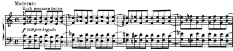
شكل يوضح تمرين رقم (٣٢)