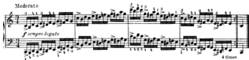
شكل يوضح تمرين رقم (٢٩)

تمرين رقم ٢٩ التدريب فى سلالم متنوعه بأستخدام علامات تحويل فى كل مازورة على حده وميزان \frac{3}{4} مع العزف القوى (F) المتصل بسرعه متوسطة حيث تؤدى اليدين معا "نغمات متماثلة صعودا وهبوطا فى اتجاه واحد على ايقاع \frac{3}{4} والضغط بقوة الأكسنت < فى بدء كل علامة ايقاعية .