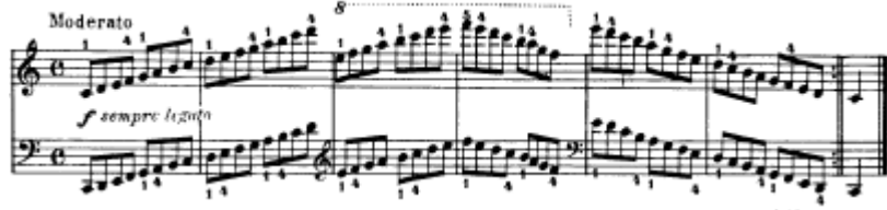
شكل يوضح تمرين رقم (٢٦)

تمرين رقم ٢٦ نغمات سلمية تصعد مع استخدام الأوكتاف الأعلى ثم تنوالى للهبوط مع عدم استخدام اى علامات تحويل وميزان C وسرعه معتدلة وأداء متصل مع تغيير فى مفاتيح الأداء م(٥،٣) ويشير المؤلف للتدريب أربع مرات متتالية .