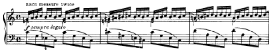
شكل يوضح تمرين رقم (١٩)

تمرين رقم ١٩ انتقل تثبيت النغمات لليد اليمنى مع ايقاع \text{♩} وتثيب البلانش لكل اثنين ايقاع مع التحويلات المتكرره للأداء في سلام متنوعه وقوس قصير يربط نهاية كل مازورة بما يليها أما اليد اليسرى تؤدي ايقاع \text{♩} في صورة أريجات هابطة ثم صاعدة بشكل مترابط على التوالي مع تغيير مفتاح الأداء م (٢٢،١٠) .